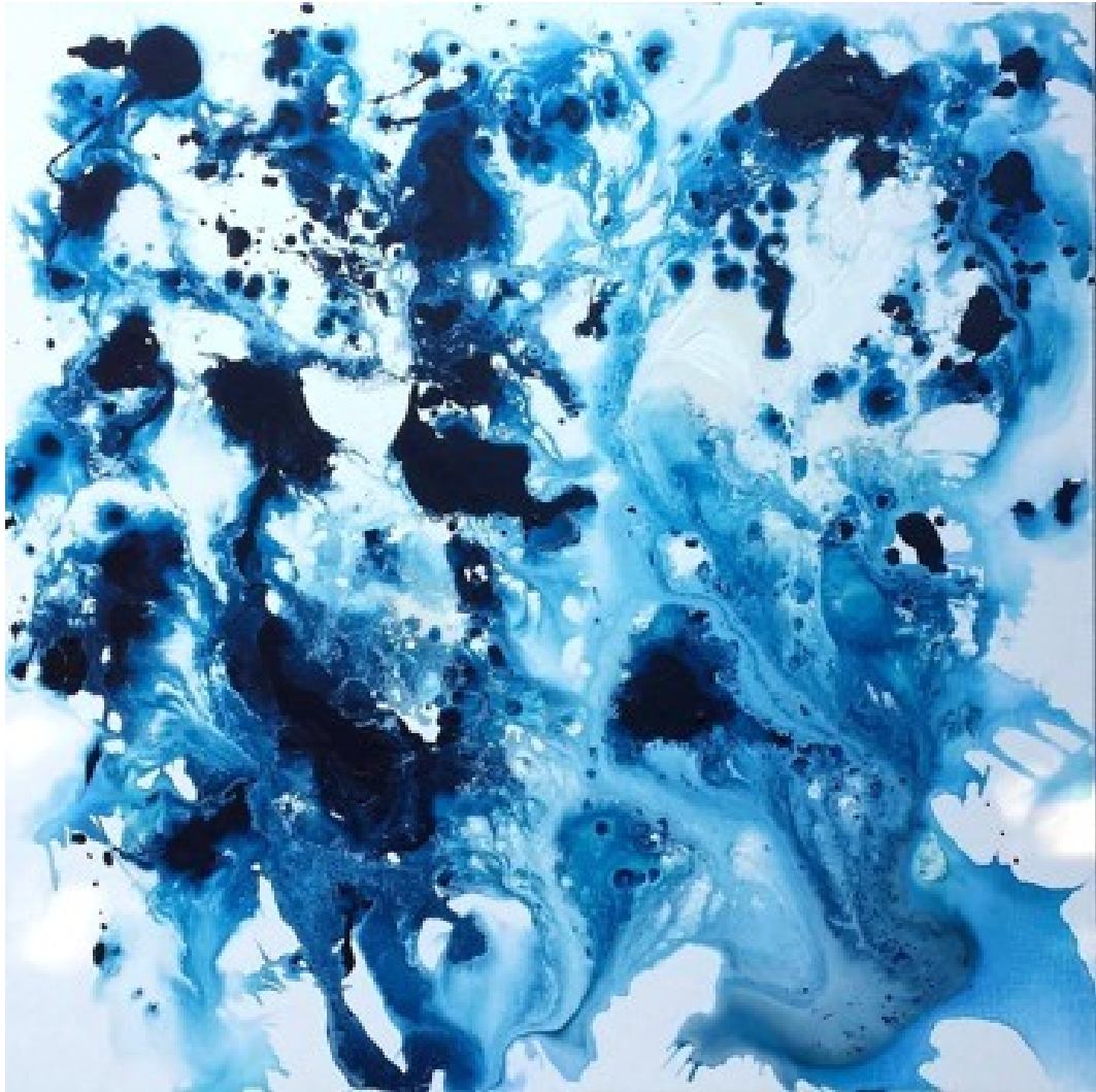
"Eau tant en emporte la couleur" / "Gone with water colors" Acrylique sur toile/ acrylic on canvas, 100 x 100 cm