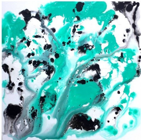
"Eau tant en emporte la couleur"/ "Gone with water colors" Acrylique sur toile/ acrylic on canvas, 80 x 80 cm chacun/ each