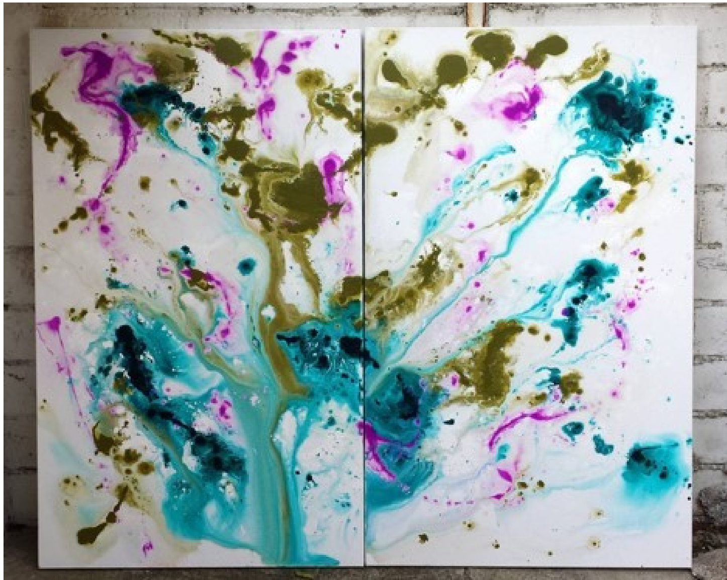
"Eau tant en emporte la couleur" / "Gone with water colors" Acrylique sur toile/ acrylic on canvas, 2 x 146 x 89 cm (146 x 178 cm)