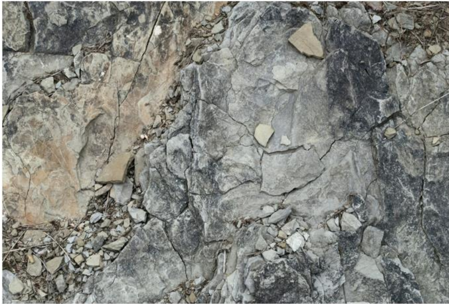
Dominique Robin, Stone Puzzles , 110X80cm (2017)

La galerie accorde également une place centrale à la scénographie et à la narration accompagnant le visiteur tout au long de son parcours.