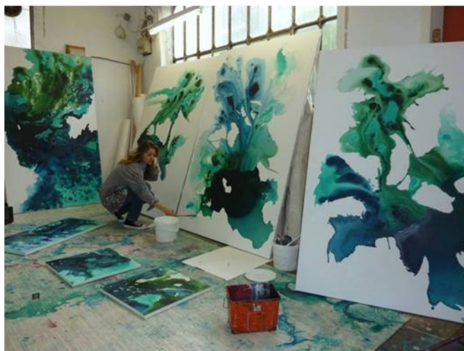
Dans l'atelier de Vitry-sur Seine, préparation des Métamorphoses des fluides , 2012

Le Pavillon de l'Eau, avec la Ville de Paris et Eau de Paris, a consacré une exposition à sa série Métamorphoses des Fluides , de septembre 2012 à février 2013. Elle a commencé à exposer ses premières installations éphémères, inspirées des Nymphéas de Monet, dans les étangs du Château de Flers (Normandie), en 2014, puis à la Cité des Sciences et de l'Industrie de La Villette, ainsi qu'à l'ENSTA (Institut Polytechnique de Paris). En 2017, elle a investi les deux étages de l'Abbaye de Vertheuil (Médoc) avec ses installations monumentales sur papier, « Mémoires d'eau », puis en 2021 elle est de nouveau invitée à exposer ses peintures récentes en dialogue avec les collections impressionnistes du Musée de Flers. En 2022, un grand triptyque sur toile libre, issu du cycle des Toiles d'eau , a été sélectionné pour participer, parallèlement à la 59ème Biennale de Venise, à une exposition au Palazzo Bembo situé sur le Grand Canal.